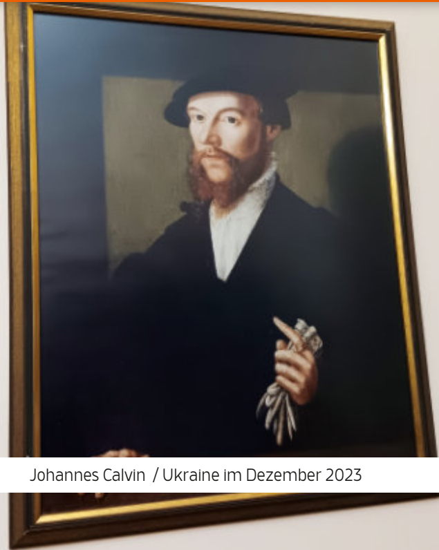
Johannes Calvin / Ukraine im Dezember 2023