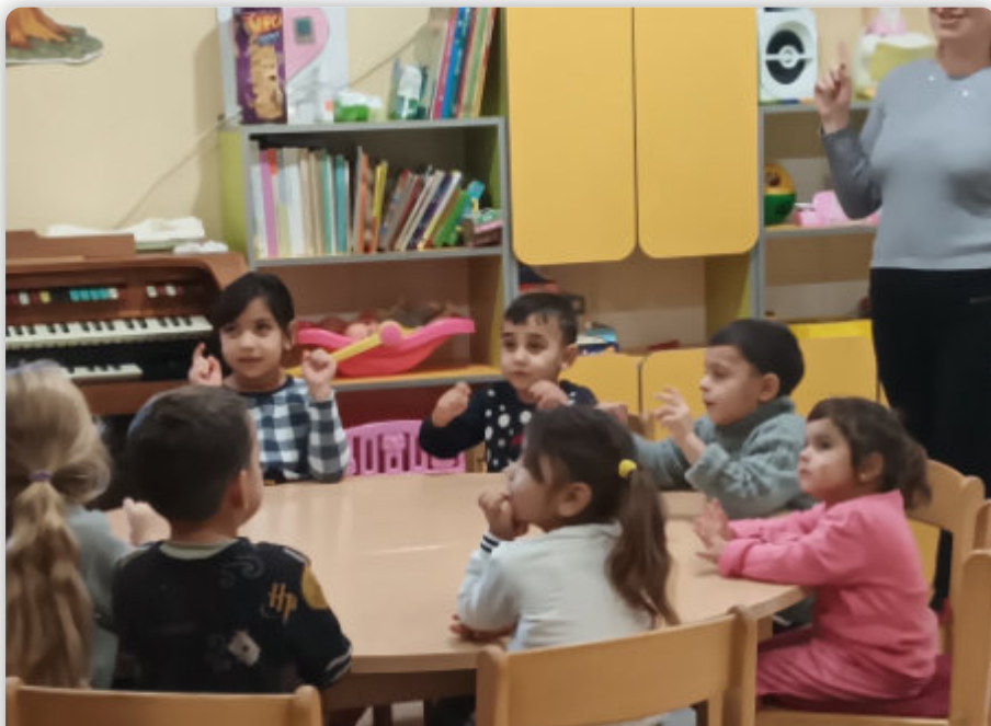
Romakinder in der diakonischen Betreuung / Ukraine im Dezember 2023