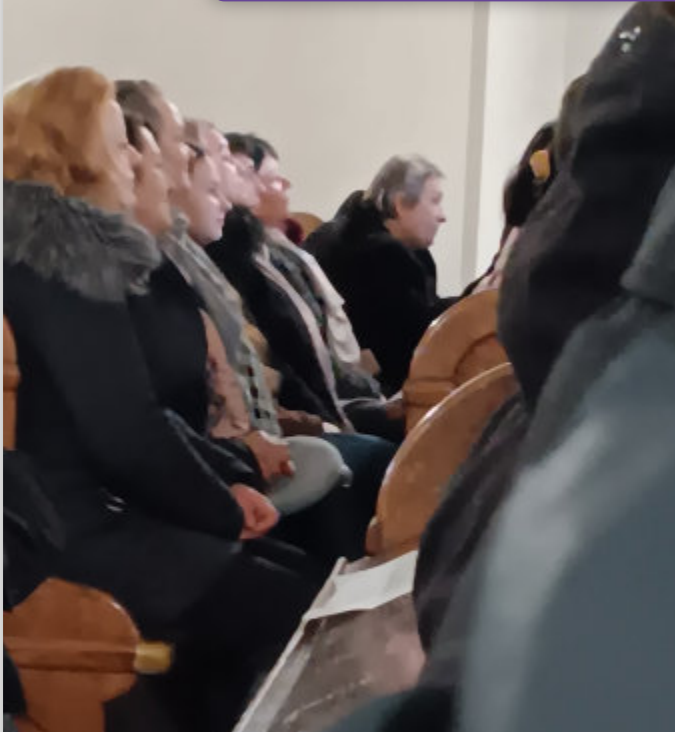
Frauenabendgebet für Männer an der Front Ukraine im Dezember 2023