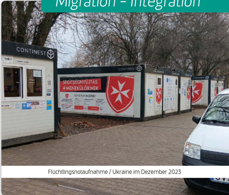
Flüchtlingsnotaufnahme / Ukraine im Dezember 2023